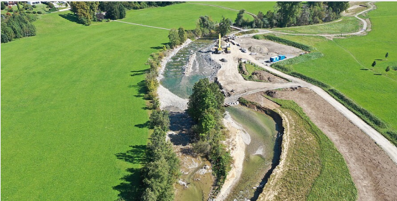
Kai Ruedel | RPT

Insgesamt wurden für die 3,5 Kilometer lange Maßnahme – eine der längsten Flussrenaturierungen im Land – rund 6 Mio. Euro investiert.