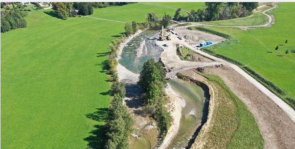
Kai Ruedel | RPT

Insgesamt wurden für die 3,5 Kilometer lange Maßnahme – eine der längsten Flussrenaturierungen im Land – rund 6 Mio. Euro investiert.