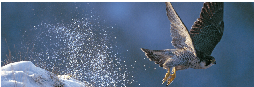
Dietmar Nill | Archiv LUBW

*MaP = Managementplan — = Verfahrensstand