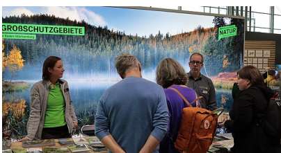
Geschäftsstelle Biosphärengebiet Schwäbische Alb

Regierungspräsidium Tübingen bietet 2025 landesweit Meisterprüfungen im Beruf Hauswirtschaft an