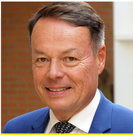
Regierungspräsident Klaus Tappeser

Mehr erfahren zum Thema Regierungspräsident Klaus Tappeser