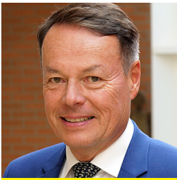
Regierungspräsident Klaus Tappeser

Mehr erfahren zum Thema Regierungspräsident Klaus Tappeser