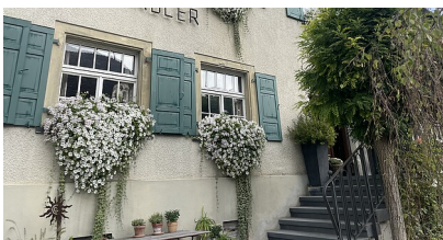
Irmgard Bodenmüller | Ref. 23 | RPT

B 28, Bad Urach, Ausbau der Knotenpunkte „Wasserfall“ und „Hochhaus“