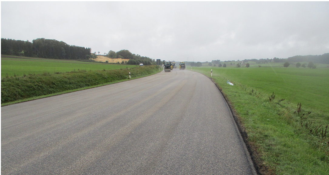
B 28 mit Blick in Richtung Römerstein-Zainingen

Beginn des zweiten Bauabschnitts am 5. Oktober 2023.