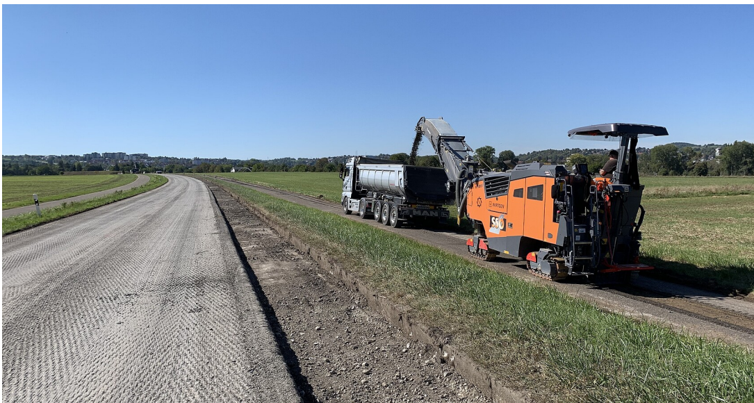
Rückbau der L 370

Umsetzung der Ausgleichsmaßnahme Teilrückbau der L 370 zwischen Rottenburg und Tübingen-Weilheim liegt im Zeitplan.