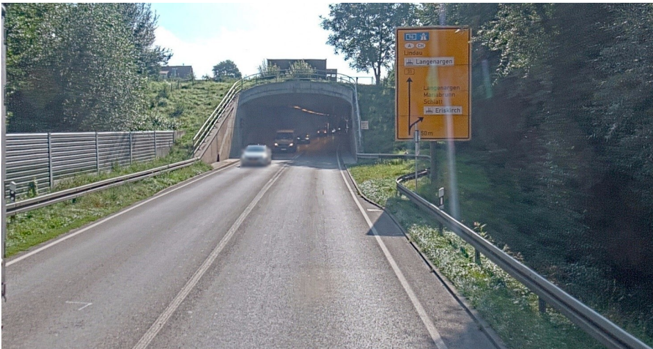
B 31 zwischen Eriskirch und Kressbronn

Abschnitt zwischen Eriskirch und Oberdorf fertiggestellt.