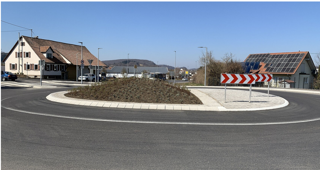
Neuer Kreisverkehr in Kleinengstingen