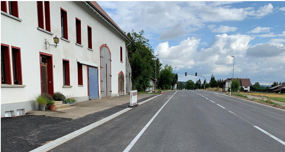
Straßenbauarbeiten auf der B 313 zwischen Engstingen und Trochtelfingen

Aufbringen der Endmarkierung ab Mittwoch, 6. September 2023.