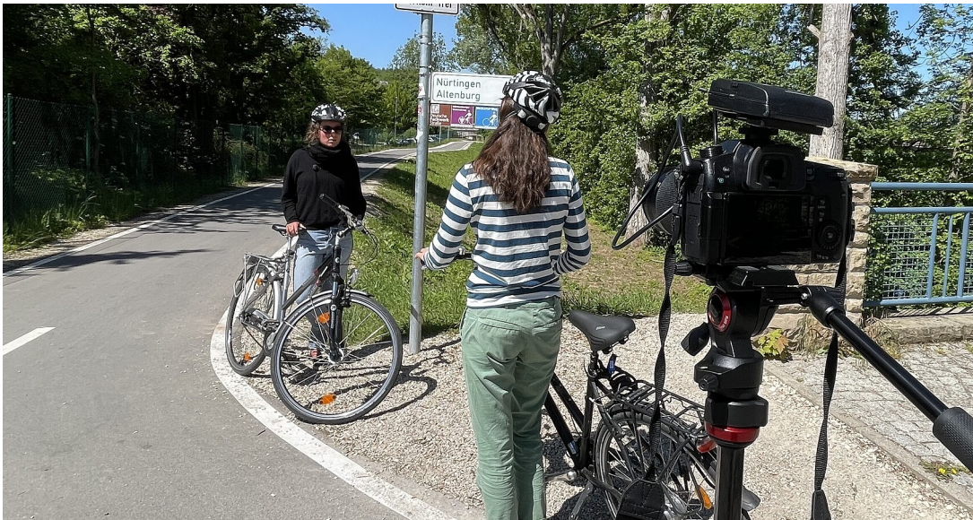
Interview der Radwegbeauftragten