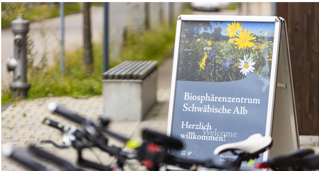
Begrüßungsschild beim Eingangsbereich des Biosphärenzentrums Schwäbische Alb