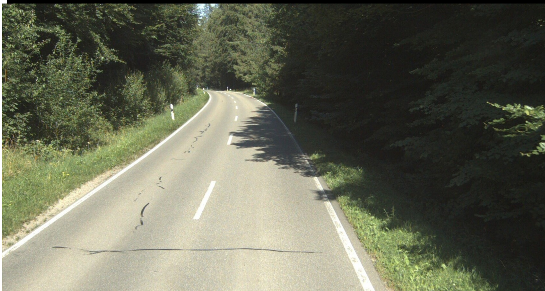
L 280 Heggbach - Schönebürg