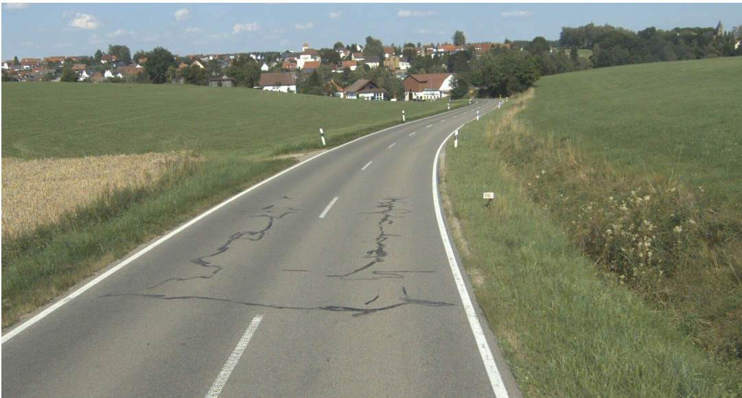
L 280 Heggbach - Schönebürg

Heller Ingenieurgesellschaft mbH Darmstadt