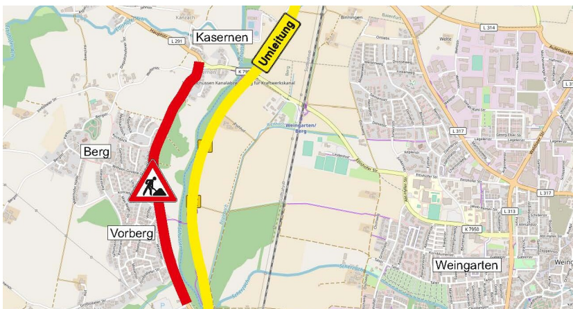
Umleitung L 291 Berg - Kasernen