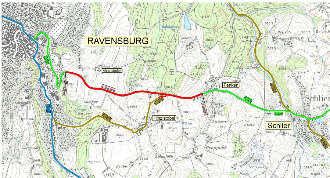
Übersichtslageplan L 325 Albertshofen - Fenken

Regierungspräsidium beginnt mit der Planung zum Ausbau der Landesstraße sowie zum Neubau eines begleitenden Radwegs.