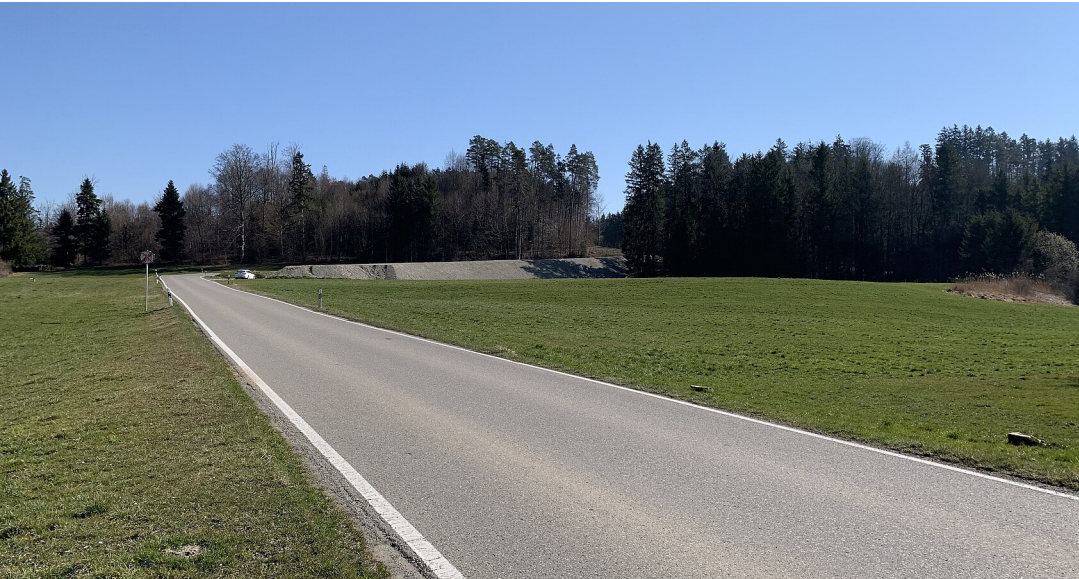
L 333 zwischen Pffegelberg und Primisweiler