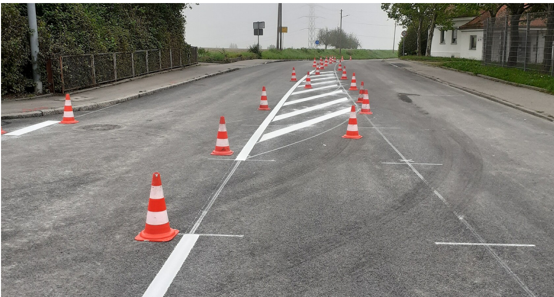
Markierungsarbeiten und der neue Straßenzustand der L 378 zwischen Reutlingen-Rommelsbach und Reutlingen-Oferdingen

Abschluss der Belagserneuerung am Donnerstag, 2. September 2021