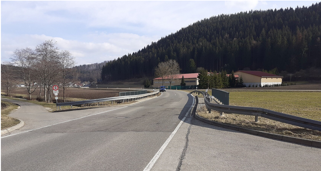
L 385 zwischen Melchingen und Stetten unter Holstein