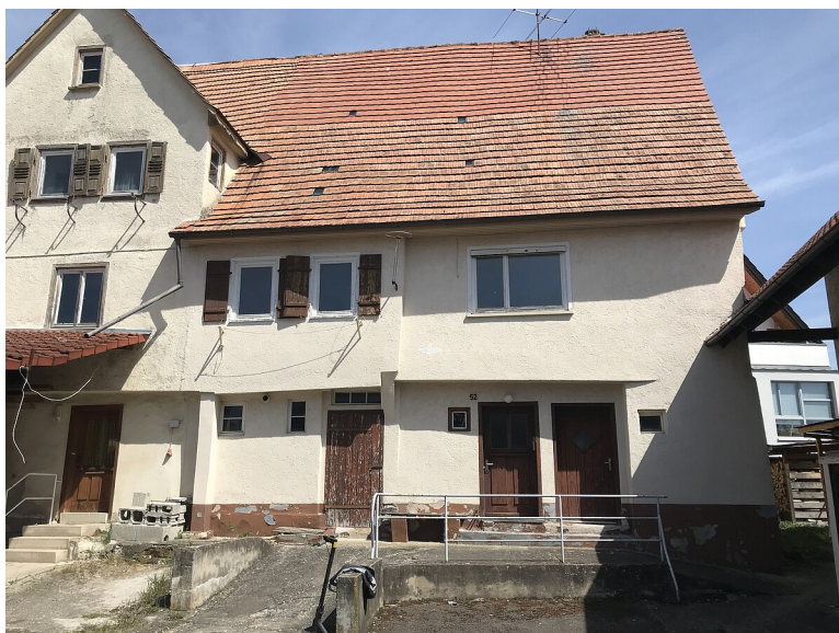
Gebäudeansicht, 71083 Herrenberg-Kayh, Hauptstraße 52