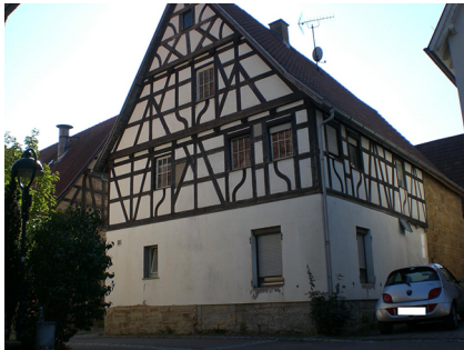
Aussenansicht, 71126 Gäufelden, Kirchgasse 3