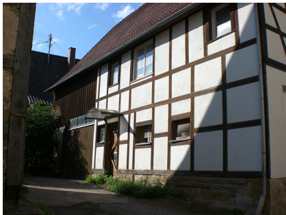
Außenansicht, 71126 Gäufelden, Kirchgasse 3