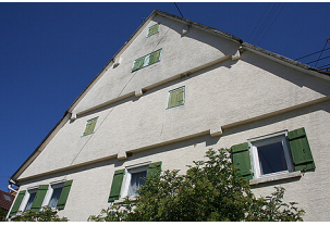
Außenansicht des Gebäudes Heubergstraße 5, Waldachtal-Salzstetten