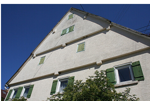
Außenansicht des Gebäudes Heubergstraße 5, Waldachtal-Salzstetten