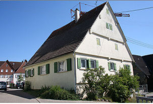
Außenansicht des Gebäudes Heubergstraße 5, Waldachtal-Salzstetten