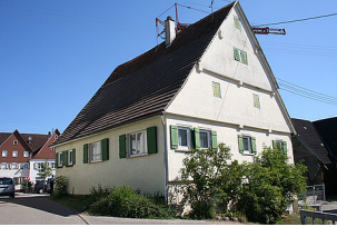
Außenansicht des Gebäudes Heubergstraße 5, Waldachtal-Salzstetten