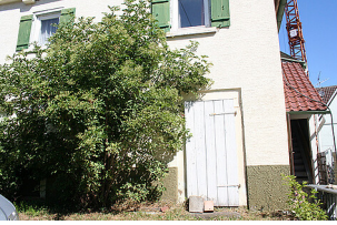
Außenansicht des Gebäudes Heubergstraße 5, Waldachtal-Salzstetten