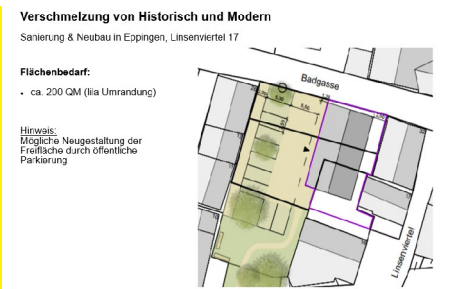
Lageplan, 75031 Eppingen, Linsenviertel 17