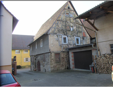
Außenansicht, 75031 Eppingen-Richen, Hintere Gasse 21