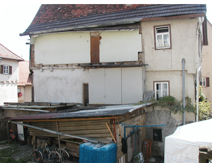
Bildrechte beim Anbieter

Außenansicht, 75031 Eppingen-Kleingartach, Zabergäustraße 16