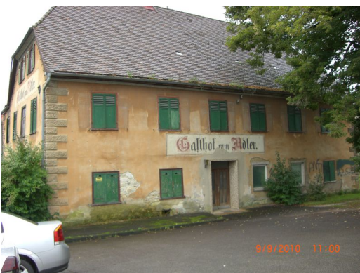
Gebäudeansicht, 73450 Neresheim (Härtsfeld), Vorstadtstraße 1