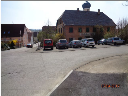
Gebäudeansicht, 73450 Neresheim (Härtsfeld), Vorstadtstraße 1