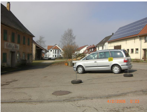
Gebäudeansicht, 73450 Neresheim (Härtsfeld), Vorstadtstraße 1