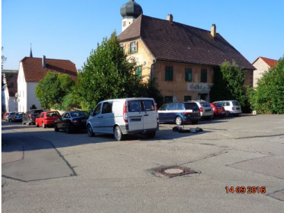
Gebäudeansicht, 73450 Neresheim (Härtsfeld), Vorstadtstraße 1