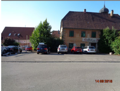
Gebäudeansicht, 73450 Neresheim (Härtsfeld), Vorstadtstraße 1