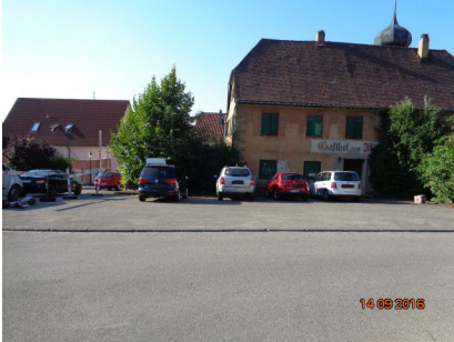
Lageplan, 73450 Neresheim (Härtsfeld), Vorstadtstraße 1