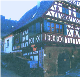
Gebäudeansicht, 71732 Tamm, Hauptstraße 29