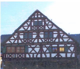
Gebäudeansicht, 71732 Tamm, Hauptstraße 29