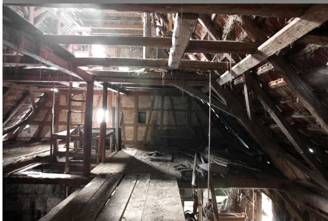
Dachgeschoss Scheuer, 72348 Rosenfeld-Leidringen, Erzinger Straße 30