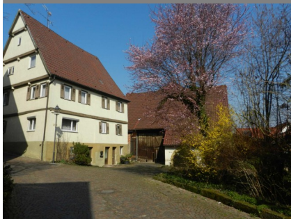
Gebäudeansicht, 74235 Erlenbach, Berggasse 20