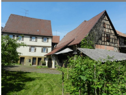
Vorderansicht, 74235 Erlenbach, Berggasse 20