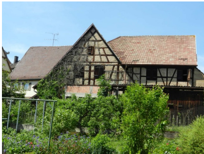
Gebäudeansicht, 74235 Erlenbach, Berggasse 20