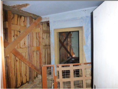
Gebäudeansicht, 74626 Bretzfeld-Rappach, Edelmanstraße 13