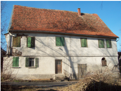
Gebäudeansicht, 74626 Bretzfeld-Rappach, Edelmanstraße 13