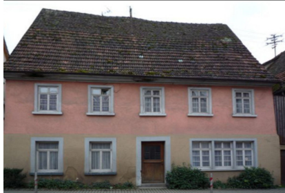
Gebäudeansicht, 74677 Dörzbach, Hauptstraße 14