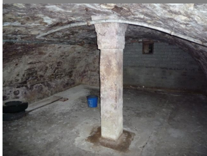
Ansicht Brauhaus, 74677 Dörzbach, Hauptstraße 14