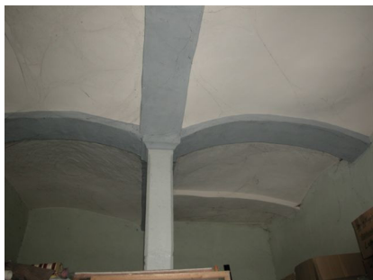
Innenansicht, 74677 Dörzbach, Hauptstraße 14