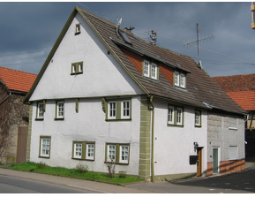
Außenansicht des Gebäudes Hardheim-Bretzingen, Erfstalstraße 19