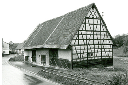
Gebäudeansicht, 88356 Ostrach-Levertswailer, Weithartstraße 27