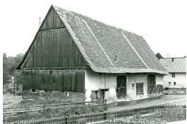
Gebäudeansicht, 88356 Ostrach-Levertswailer, Weithartstraße 27