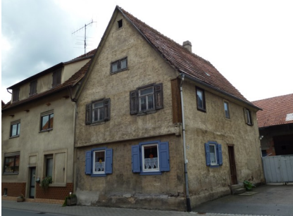
Gebäudeansicht, 97956 Werbach, Hauptstraße 11 und 13