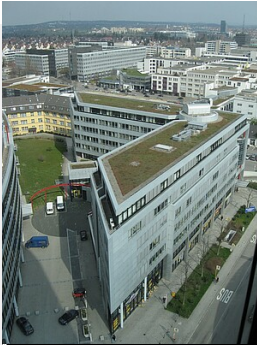
Markus Böhm für RPS