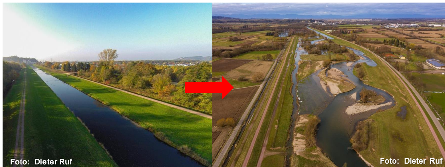
Damnrückverlegung: Ausgangszustand Elz Nov. 2015 (links), revitalisierte Elz Feb. 2020 (rechts)