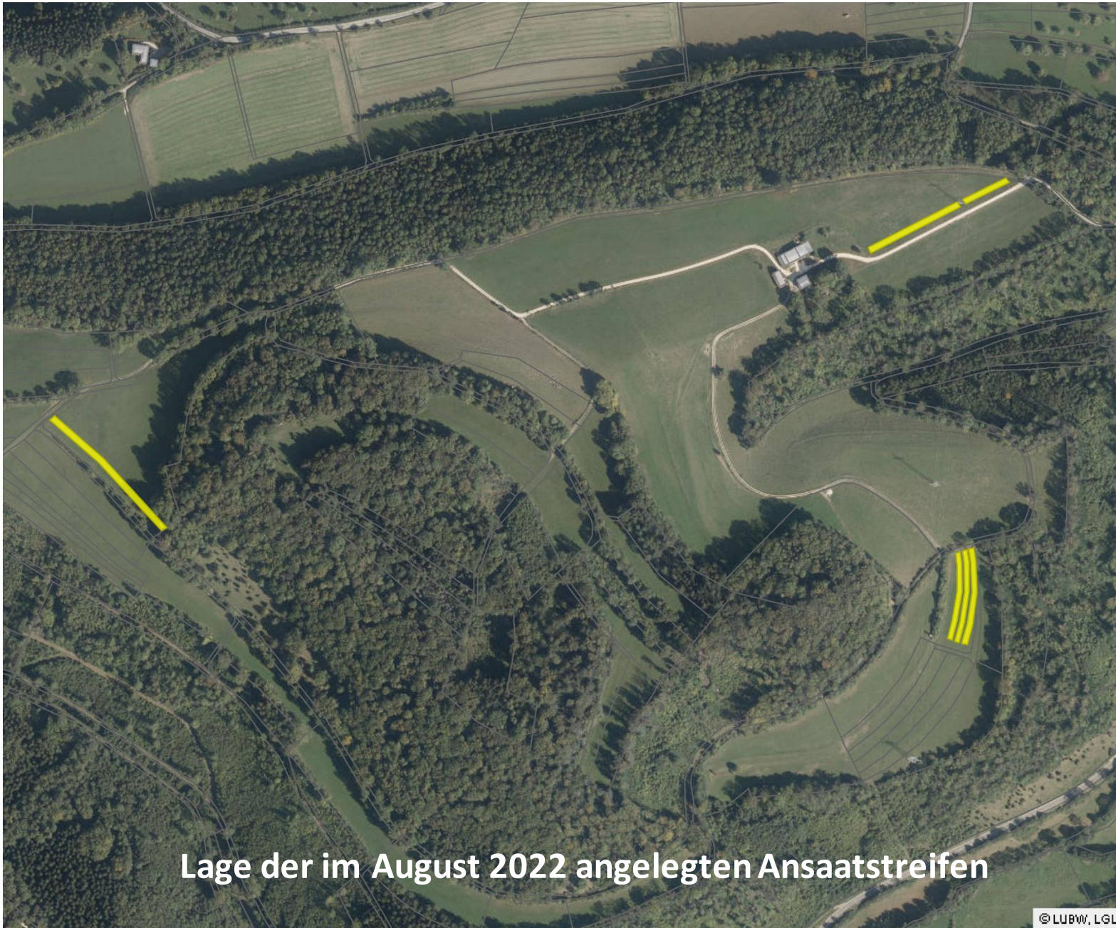
Lage der im August 2022 angelegten Ansaatstreifen