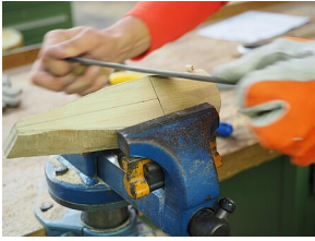
Holzarbeit mit Zieheisen